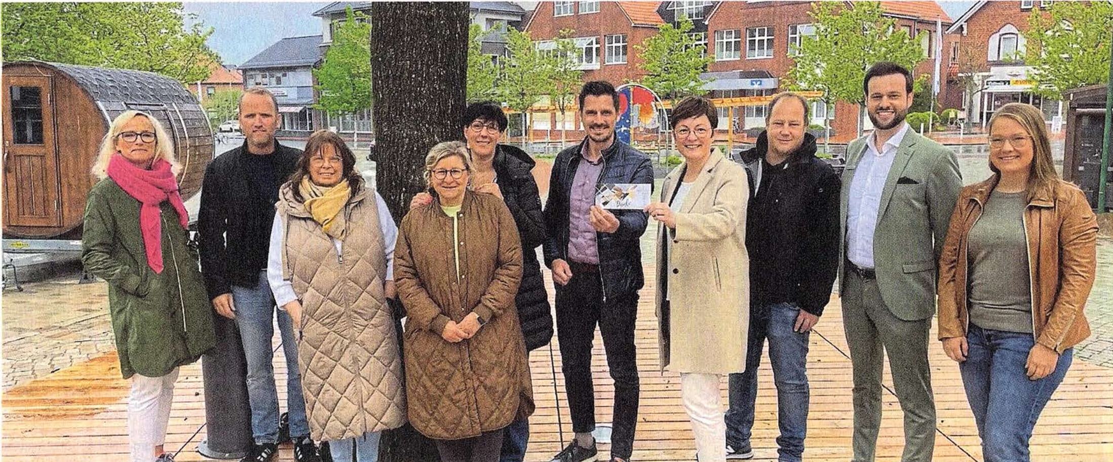
Vorfreude bei den Wirten und Kulturschaffenden um Bürgermeister Jens Bley (6.v.l.). Zur Eröffnung des Centralplatzes ist Sonnenschein bestellt, scherzt die Gruppe.