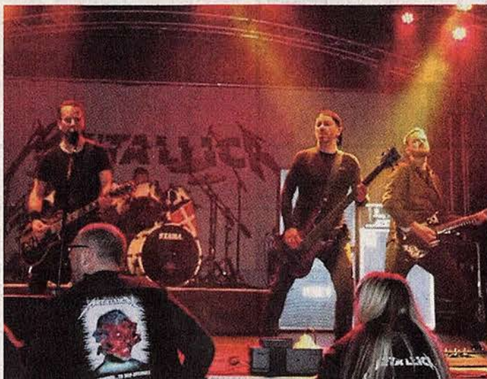
Rockten die Bühne: MyTallica.